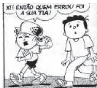
Ziraldo. “O menino maluquinho”. In O Globo , 30/3/2005, Segundo Caderno, p. 9.